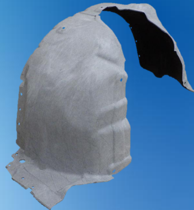
プロテクターフェンダー フロント プロテクターフェンダー リア