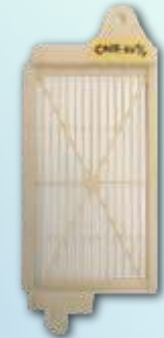
チップングガード