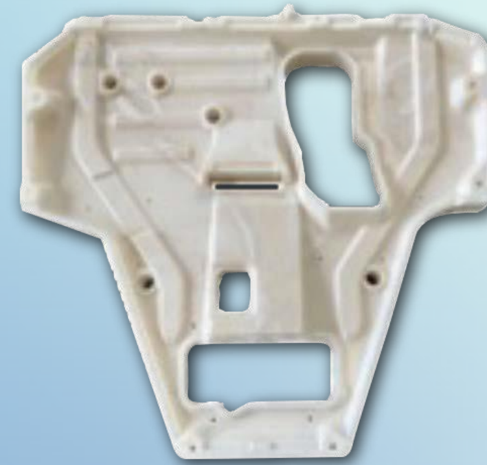
エンジンアンダーカバー