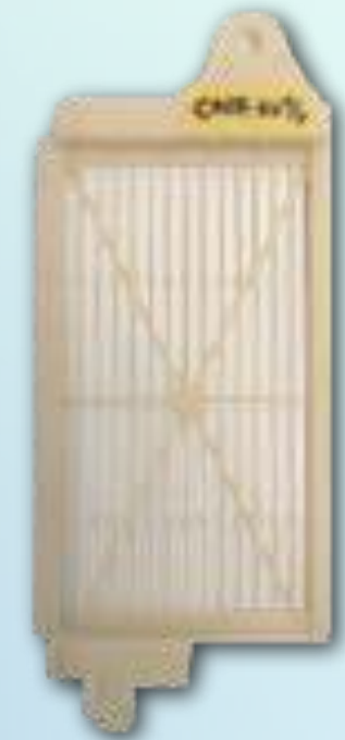
チッピングガード